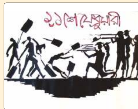
Third Position Holder Soumadeep Mukherjee, B.Pharm (2nd Yr)