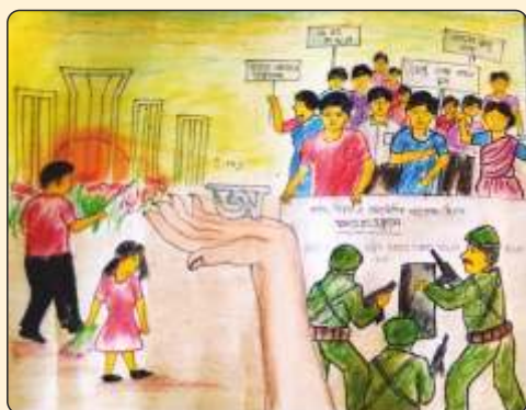
First Position Holder Anubhab Sutradhar, B.Pharm (2nd Yr)